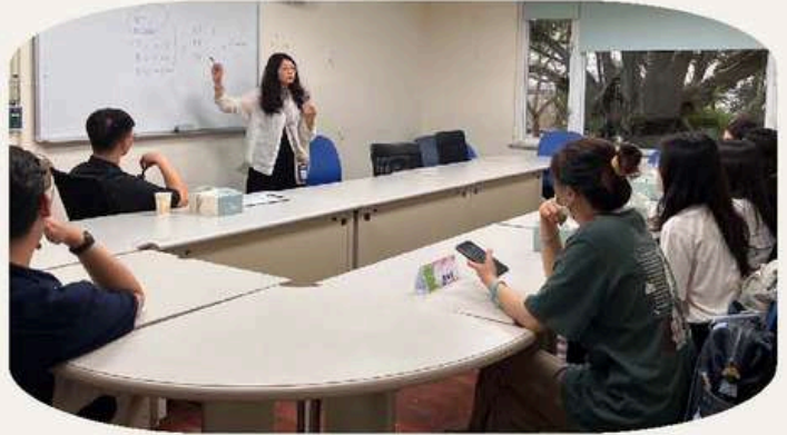
▲ 碩博新生座談 113.06.15