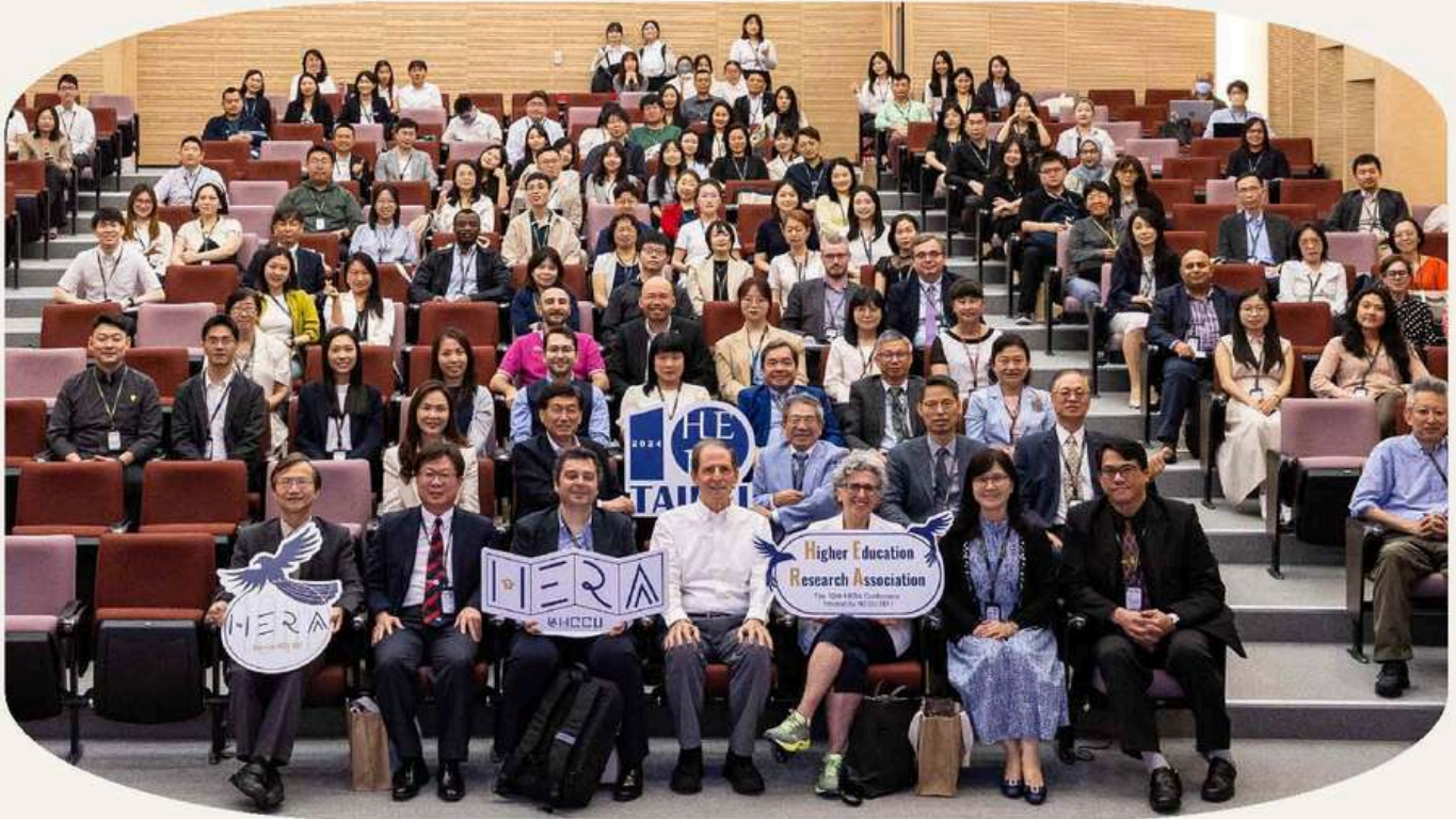
▲ 第十屆HERA國際研討會 113.06.05-06.06

教育學系主辦第十屆HERA國際研討會，吸引了來自25國的190篇論文和200多位學者參與，包括多位國際知名學府的學者，進行全程英文的學術交流，並有SSCI期刊主編參與，討論可能集結為特刊的論文。