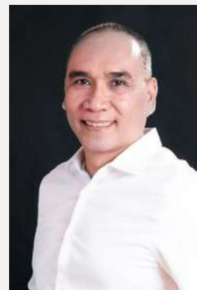
▲照片來源:學行碩提供

特別邀請菲律賓UNIVERSITY OF ST. LA SALLE的DIO院長，透過線上演講的方式分享何謂ISO品質管理體系標準與ISO 9001:2015在學校評鑑中的角色，以及如何透過ISO提升學校教育品質與管理效率。