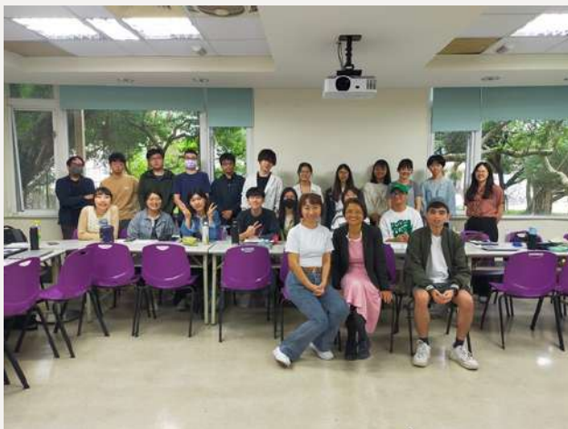
▲照片來源:師培中心提供

112學年度起開設雙語教學次專長課程，並辦理6場次雙語工作坊，預計學期結束有7名學生能順利加註雙語教學次專長。